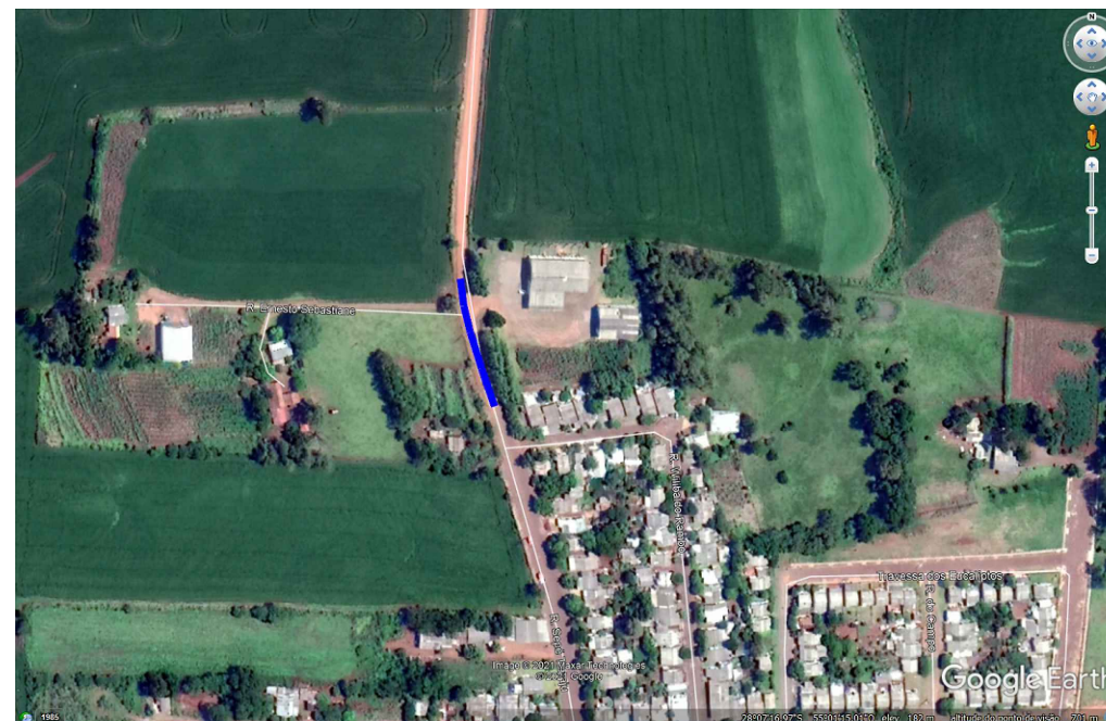
Imagem Satélite Localização